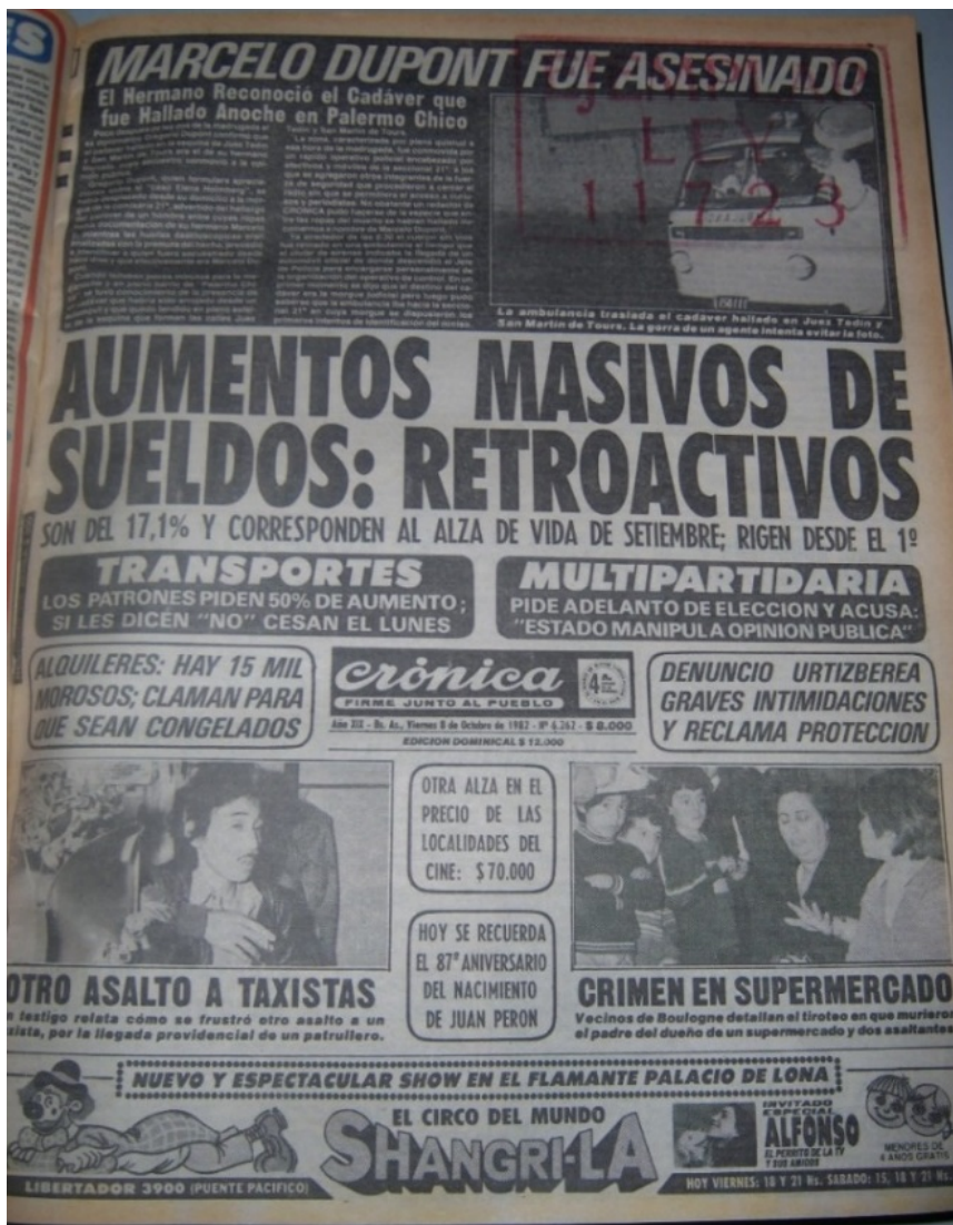
FIGURA 1 Portada de Crónica , 8 de octubre de 1982