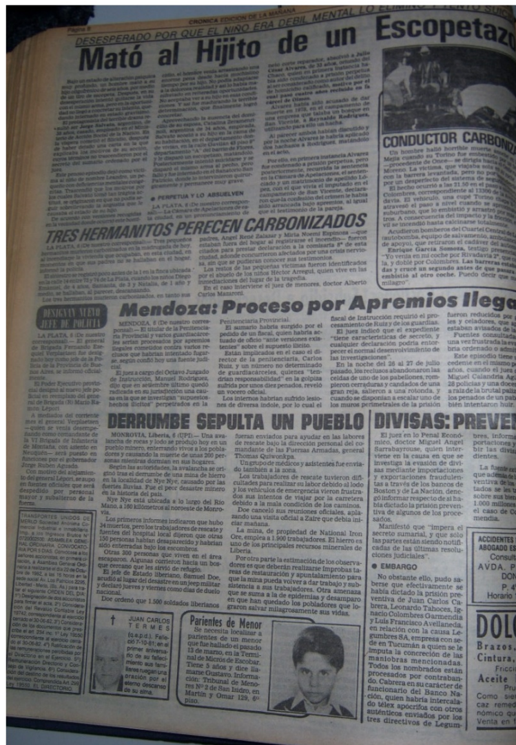
FIGURA 3 Interior de Crónica , 7 de octubre de 1982 (p. 8)

propiedad privada); 10 sobre delitos aduaneros (contrabando), impositivos y estafas; y 4 sobre narcotráfico. En mayo de 1983 se relevaron: 19 sobre casos connotados; 12 sobre delitos comunes; 17 sobre siniestros viales (accidentes automovilísticos y ferroviarios) y catástrofes; 5 sobre narcotráfico; y 4 sobre delitos aduaneros (contrabando), impositivos y estafas. Las fotos seleccionadas permiten ilustrar los motivos temáticos priorizados por el diario en su agenda policial.