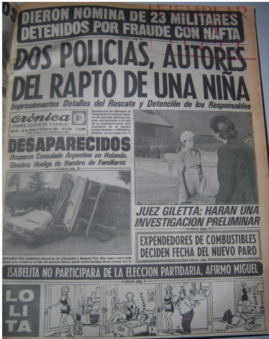
FIGURA 2 Portada de Crónica , 27 de mayo de 1983

Respecto de la agenda de los derechos humanos en la prensa popular argentina, Leila Orsaria y Martín Jorge Biscussi (2017) confirman que durante el período 1986-2007 Crónica y Diario Popular «desplazaron el interés hacia las noticias relacionadas con las medidas políticas en torno al terrorismo de Estado y la violación de los Derechos Humanos ocurridos entre 1976-1983, sin por eso alterar el contrato de lectura» (p. 10). Si bien su investigación toma un período posterior al considerado en este artículo, permite confirmar la tendencia del diario –ante determinadas coyunturas– a otorgar centralidad en su sumario informativo a noticias políticas; específicamente, a aquellas vinculadas con el terrorismo de Estado.