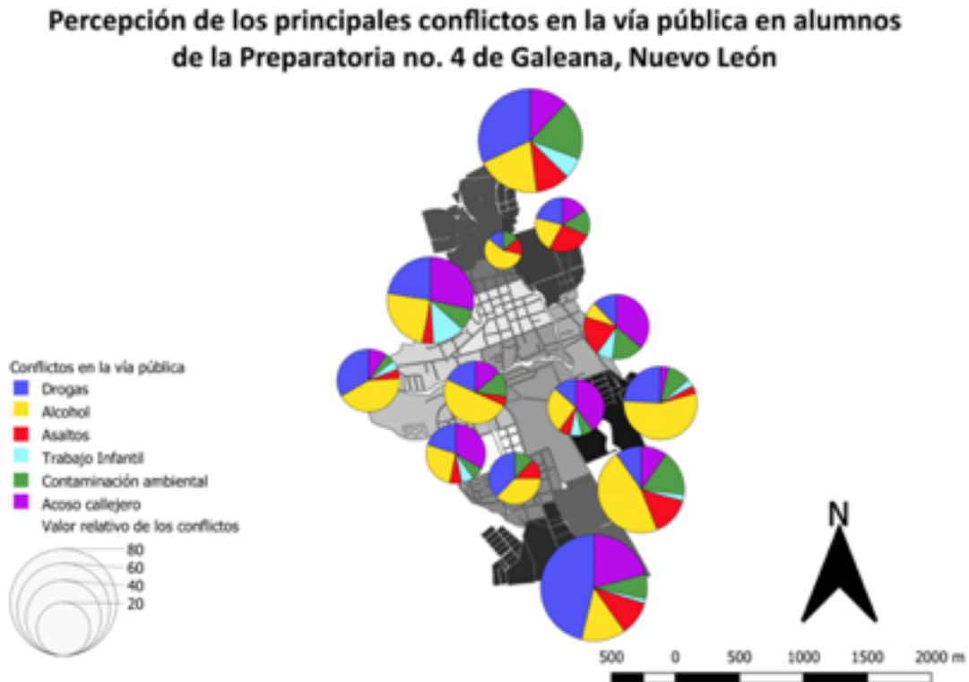
Ilustración 1 Mapa de la percepción de los conflictos públicos en Galeana

Respecto a la distribución por colonias, la percepción sobre la violencia callejera de los alumnos de la preparatoria, sita en la colonia de Las Cordeladas, queda representada por proporcionalmente representada en la Gráfico 1. Finalmente, utilizando el Software de Sistemas de Información Geográfica QGIS en su versión 3.4, obtuvimos el siguiente mapa: