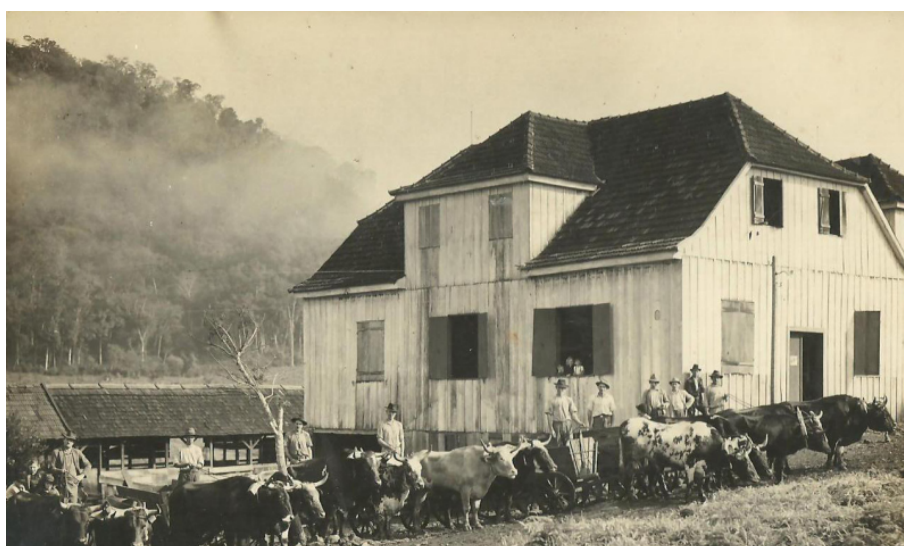
FIGURA 7 Posto de compras de suínos da Sadia, 1948.

O aumento da frota de caminhões paulatinamente promoveu o abandono dessas formas de transporte de animais. Na Figura 8, é possível observar o uso de caminhões no transporte para o frigorífico da Família Hoss, em São Carlos, no ano de 1956.