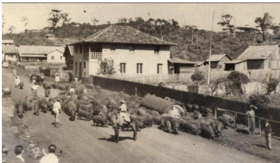
FIGURA 6 Tropa de porcos em São Lourenço do Oeste, 1952.