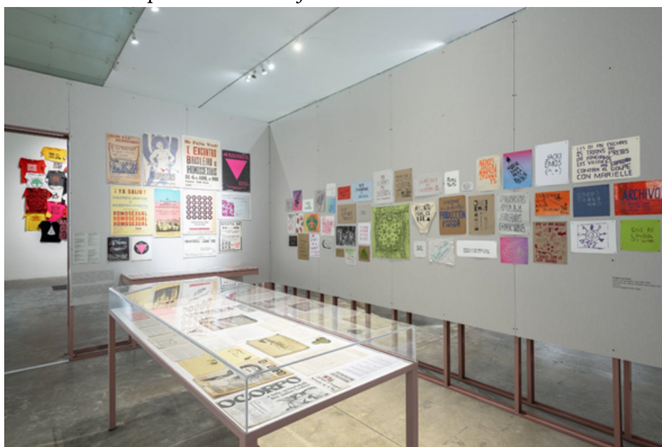
IMAGEN 6 Exposición Giro Gráfico: como el muro en la hiedra