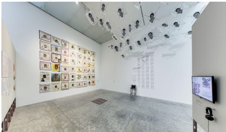
IMAGEN 5 Exposición Giro Gráfico: como el muro en la hiedra