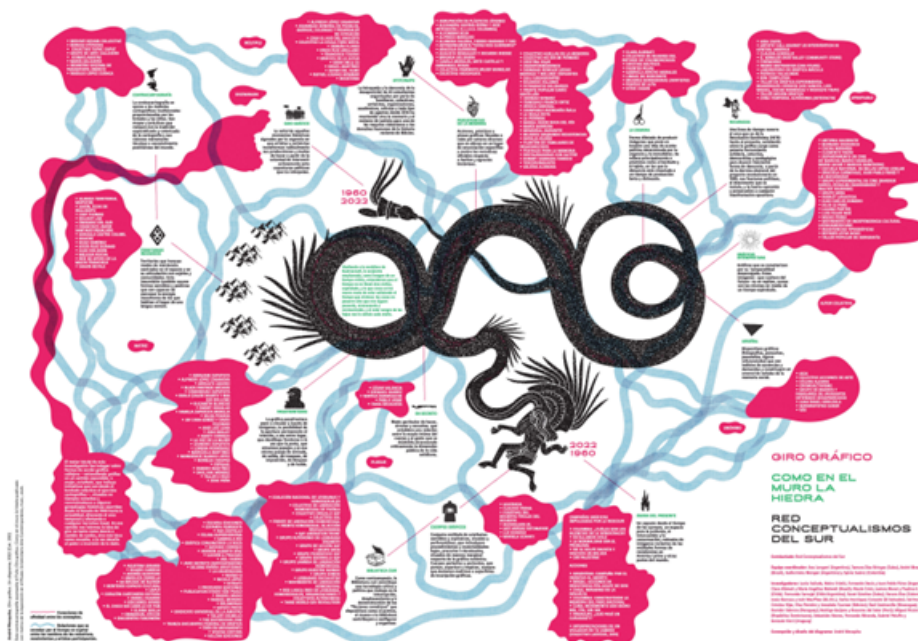
IMAGEN 7 Exposición Giro Gráfico: como el muro en la hiedra