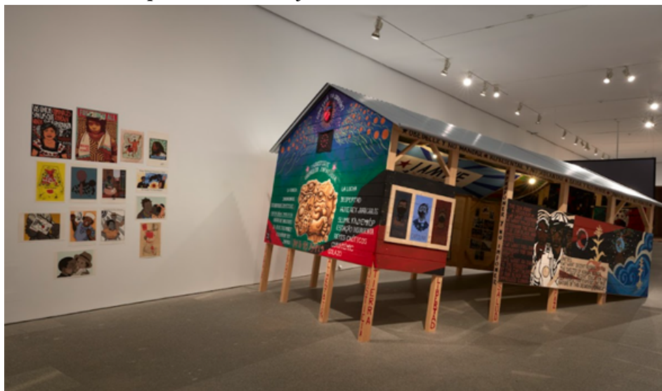
Exposición Giro Gráfico: como el muro en la hiedra