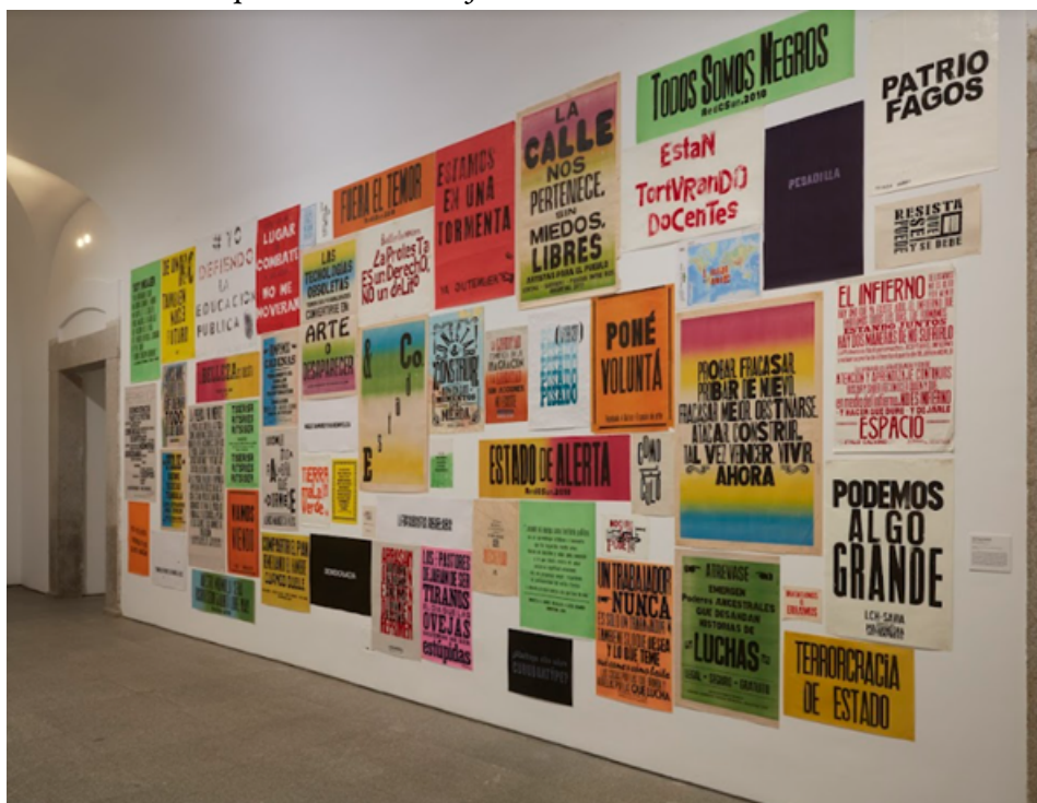
IMAGEN 1 Exposición Giro Gráfico: como el muro en la hiedra