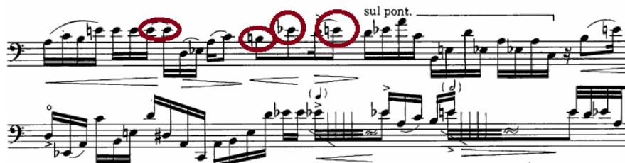
FIG. 8 Berio, les mots sont allés... , p. 2, linhas 1-2 Universal Edition

notações importantes estão presentes no decorrer da peça, sendo elas o MV (muito vibrato ) e o SV (sem vibrato ), marcadas em vermelho. Esse detalhe deixa ainda mais plausível o pensamento de que o vibrato é uma ferramenta maleável e importante – tornando-se ainda mais desafiador para o intérprete, pois o induz a realizar o vibrato de maneira consciente e exata.