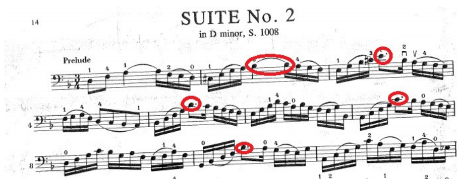
FIG. 2 Locais indicados para a realização do vibrato Edição de Edmund Kurtz

Levando em consideração a peça em questão, seria adequada a aplicação do vibrato em terminações de frases e notas suspensas, a partir da análise do encadeamento harmônico da peça. O uso moderado do vibrato é muito importante no Prelúdio em Ré menor (Fig. 2), pois o foco maior é a intenção realizada pela mão direita, obtida pelo arco, garantindo uma exposição melhor do início e término de cada frase.