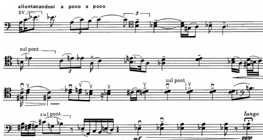
FIG. 9 Berio, les mots sont allés... , p. 1, linhas 5-6 Universal Edition

Na segunda página (Fig. 8) é onde se encontra o trecho mais rápido da peça. O vibrato se encontra nas notas mais longas, em meio das seções rápidas. Para combinar com a atmosfera e o caráter do trecho, é indicado que o vibrato tenha uma curta amplitude a fim de manter a energia desta seção.