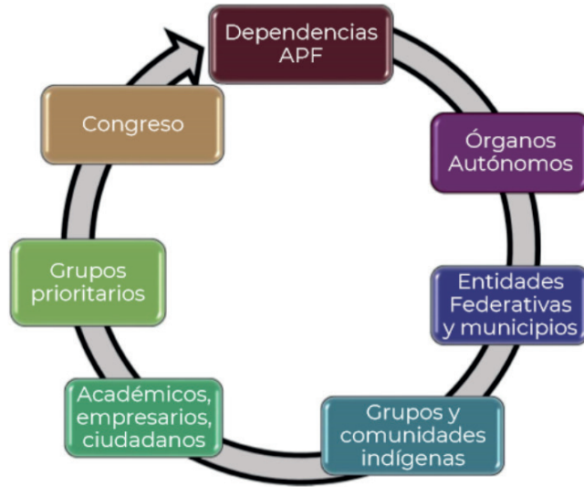
Imagen 1. Agentes que participan en la creación de PND