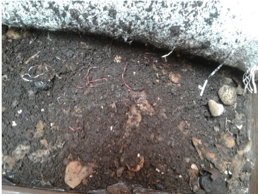
FIGURA 2. Pie de cría-Cama 1 Autores

( Spinacia oleracea ) se usaron como sustrato. Con este sustrato hay un aumento en la población de lombrices, lo que permite generar dos camas adicionales; la cama 2, tiene como sustrato un 20% de residuos de frutas (como tomate de árbol ( Solanum betaceum ), papaya ( Ciraca papaya ), guayaba ( Psidium guajava ), banano ( Musa balbisiana ), mango ( Mangifera indica )), 40 % residuos de verduras, y 40% de residuos de papa ( Solanum tuberosum ); mientras que la cama 3 tuvo como sustrato 100 % de cáscaras de plátano ( Musa balbisiana ), dichos residuos se emplearon debido a que, según el cuarteo, son los más generados en el sector. En las Figuras 2y 3 se presentan las camas.