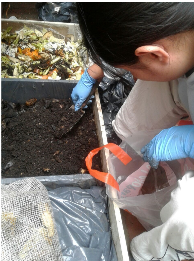
FIGURA 3. Camas 2 y 3 Autores