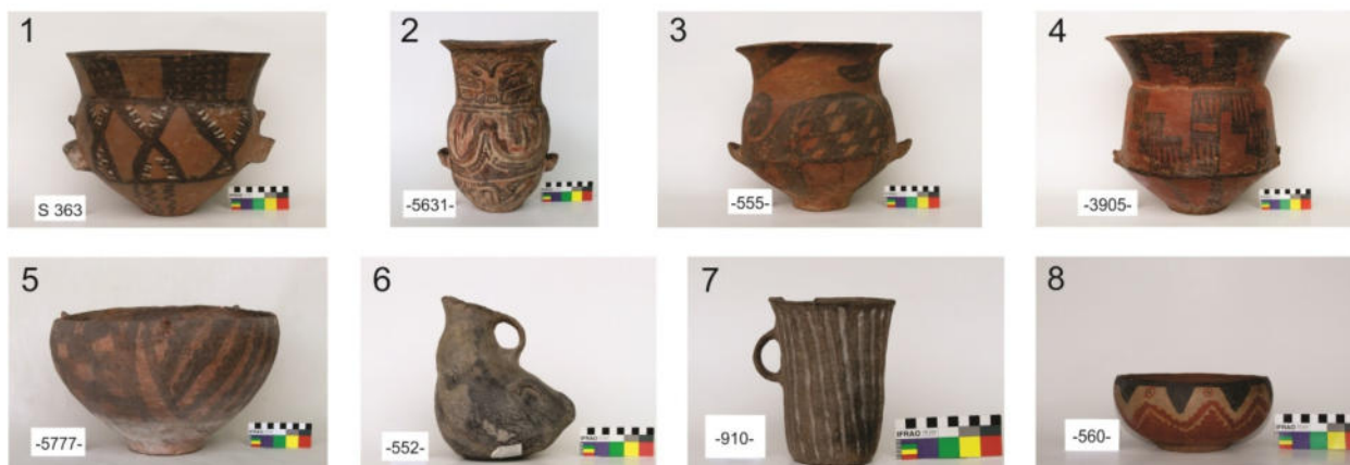
Figura 2. Materiales depositados en el Instituto de Arqueología cuando funcionada en la calle Riobamba (Antiquitas III 1966, pp.14). Se reconocen piezas que podrían provenir de la provincia de Catamarca y que actualmenete están depositadas en USAL-Pilar.