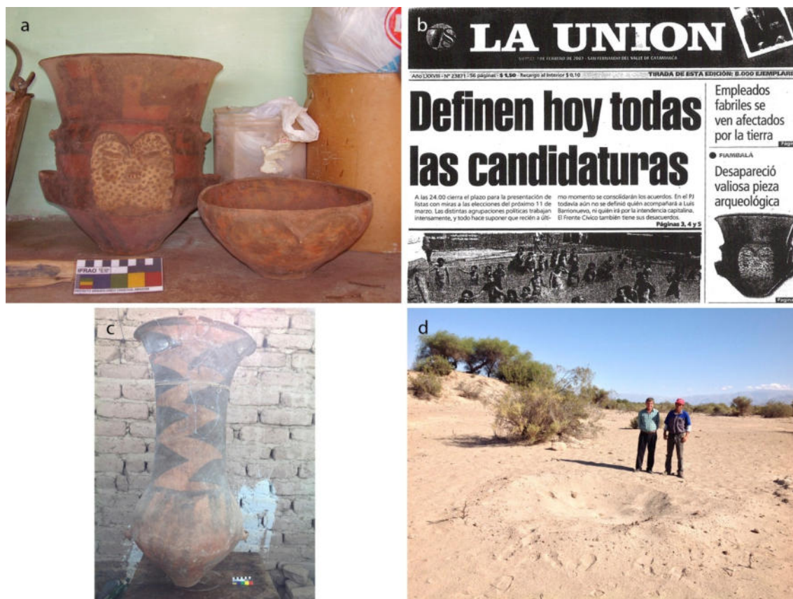
Figura 5. a. Pieza de estilo Belén negro sobre rojo, con rostro de felino moteado y b. tapa del diario La Unión, Catamarca, de 12 febrero del año 2007 donde se informa sobre la venta de la pieza. c. Urna Abaucán que contenía un entierro de adulto y d. lugar donde el poblador local excavó en el desierto y recuperó la urna y otros acompañamientos, y dejó los restos esqueléticos in situ , los que luego fueron recuperados por el PACH-A para estudios bioarqueológicos.