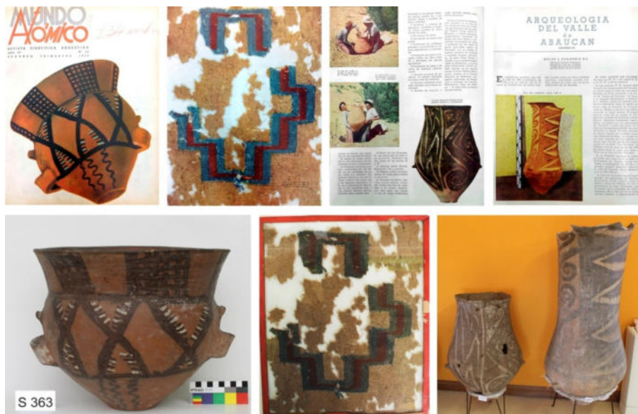
Figura 3. Arriba: Piezas cerámicas y textiles provenientes de Medanitos publicadas por Dreidemie (1951, 1953). Abajo: iguales materiales actualmente depositados en el Campus Pilar-USAL.

Una de las preguntas que surge luego del racconto realizado, es por qué tenemos la certeza de que en el Campus de Pilar-USAL se encuentra "parte" de la Colección Dreidemie. Afortunadamente la confirmación proviene de la comparación entre piezas cerámicas y textiles publicadas por el jesuita (Dreidemie 1951, 1953) y materiales depositados en el Campus (Fig. 3).