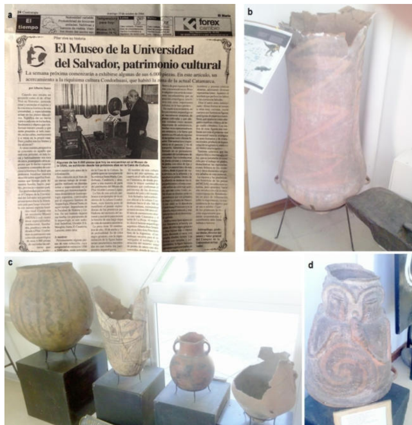
Figura 1. a. Recorte de diario local de Pilar de fecha 10 de octubre de 2004 donde anuncia la próxima apertura del MUSAL; b, c y d. fotos de vasijas cerámicas expuestas en el MUSAL al momento de poder ingresar por primera vez a la institución, 13 de agosto de 2013, Fotos N. Ratto.

Ya en la tesis doctoral de Sempé (1976) se hace mención y registro de los materiales arqueológicos que provienen del área de Medanitos y que están depositados en el Museo Jesuítico Nacional de Jesús María (MJNJM) en la provincia de Córdoba. Sin embargo, en un trabajo que el jesuita Oscar Dreidemie publicó en la Revista Mundo Atómico en su edición de 1951, donde relata los resultados de las intervenciones realizadas en cementerios de la localidad de Medanitos, dice: "El material obtenido se ha depositado, parte, en el Museo de Jesús María, parte en el laboratorio arqueológico anexo al Observatorio de Física Cósmica de San Miguel, donde se estudian en estos momentos" (Dreidemie 1951, p. 41). Es decir que Sempé (1976) había documentado parcialmente los materiales, pero la pregunta que surgía era dónde estaba la "otra parte" de la colección. Y con esta pregunta comenzó un largo recorrido que culminó en el año 2016, cuando se tuvo certeza del lugar de depósito actual de las piezas que completan la Colección Dreidemie, específicamente se encontraban en las instalaciones del Campus Nuestra Señora del Pilar de la Universidad del Salvador (USAL) ubicado en la localidad de Pilar, provincia de Buenos Aires, sede en la cual, a partir del año 2003, se organiza el Museo de la Institución –MUSAL– (Fig. 1a) 1 .