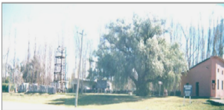
FIGURA 4 Apariencia actual del Museo Fortín Cuatrerros con el mangrullo y ejemplar de gualeguay

Algunos años después se efectuó una revisión por la cual la designación de Monumento Histórico Nacional se cambió a la categoría de Lugar Histórico (Pupio y Perrière, 2013), puesto que los componentes correspondían a tiempos distintos, en un emplazamiento que no es el original (Pupio y Perrière, 2013). Además, haber reconstruido el fortín produce que sea un sitio reconstruido y no un patrimonio original, que como tal deberían ser las construcciones primigenias.