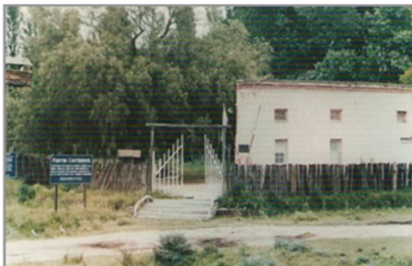
FIGURA 3 Apariencia del Fortín Cuatrerros como sitio reconstruido y funcionando como Museo en la década de 1980