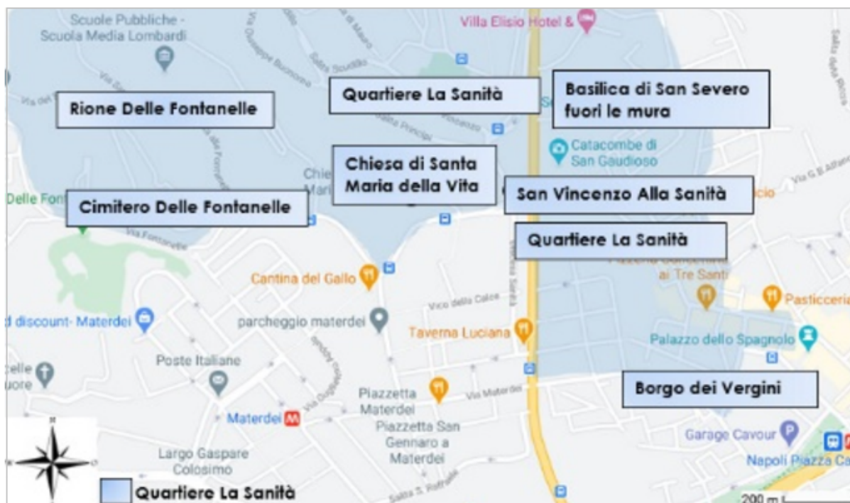
FIGURA 4 Atractivos del Rione Sanità

También como ya se dijo, se pueden visitar las Catacumbas de San Gaudioso, de San Severo y el Cementerio delle Fontanelle. En las adyacencias se encuentra el Palacio Español y el palacio San Félix construidos en 1700 y la Basílica de Santa Maria della Sanità, construida algo después. En el siglo XVIII sus calles se convirtieron en la ruta de la familia real desde el centro de la ciudad hasta el Palacio de Capodimonte (NapoliLike, 2021; Altra terra di lavoro, 2020). En el 1800 se construyó el puente, el mismo sufrió un intento de destrucción por parte de los alemanes derrotados en los Cuatro Días de Nápoles de 1943, pero un grupo de partisanos salvó el puente de la destrucción, transformándolo en símbolo de la resistencia de la Segunda Guerra Mundial (Clemente, 2015). En la Figura 3 pueden verse los principales atractivos.