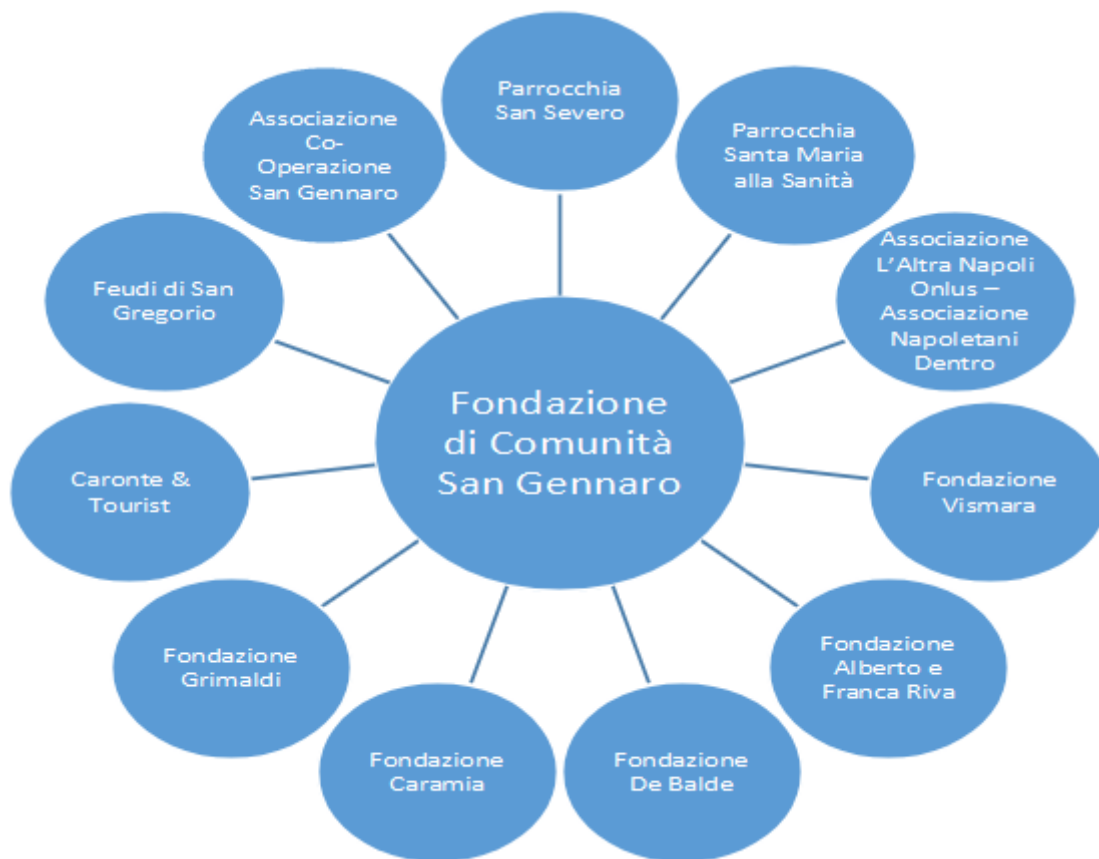
FIGURA 5 Socios Fundadores de Fondazione di Comunità San Gennaro que figuran en la Página oficial

De a poco se fue conformando un modelo de financiamiento vía proyectos públicos o mediante patrocinios privados, gestionados por las diversas asociaciones que, en 2014, como se analiza más abajo, fueron integradas en la Fondazione di Comunità San Gennaro. La prensa habló de desacuerdo con el Vaticano, principalmente respecto al porcentaje de ingresos económicos de las catacumbas que exigía la Pontificia Comisión de Arqueología Sacra ya que el mencionado patrimonio arqueológico es propiedad del Vaticano (Cernuzio, 2018).