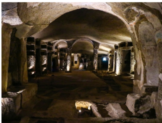
FIGURA 2. Catacumbas de San Gennaro

El proyecto bajo análisis se basa en la promoción turística del patrimonio cultural del barrio, hay para visitar principalmente las Catacumbas de San Gennaro, un cementerio de los siglos II y III d.C, y que con los años se convirtió en el más grande de todo el sur de Italia y un destino de peregrinación importante (Lamperti, 2019). Allí se hallan restos de Sant' Agrippina, la primera patrona de Nápoles y el lugar, como otros de la ciudad, fue usado durante la Segunda Guerra Mundial como refugio (Klaos, 2019).