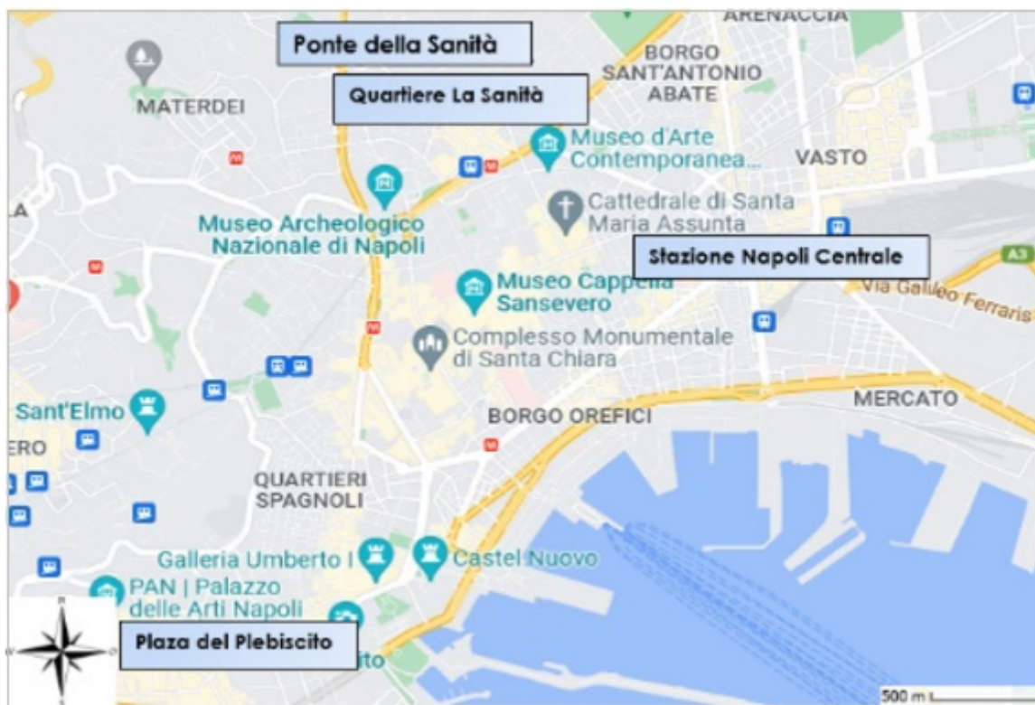
FIGURA 1. Mapa de Nápoles

Los sitios atractivos para el turismo en el barrio son las Catacumbas de San Gennaro y la Iglesia Madre del Buon Consiglio (o de San Genaro), primer hito si se desciende desde Capodimonte; la Iglesia de Santa María de la Vitta al oeste si se baja por el ascensor; y más allá el Cementerio delle Fontanelle; la plaza al este, las Catacumbas de San Gaudioso junto a la Iglesia de Santa María della Sanità y más allá la Basílica de San Severo.