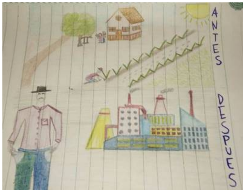
Figura 2. Estudiante 2