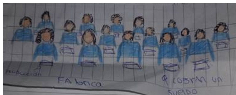
Figura 8. Estudiante 5, segundo dibujo

En los dibujos realizados se expresan algunos de los cambios que los y las trabajadoras vivieron en su vida diaria y laboral, con la instauración del capitalismo como sistema social, y el avance de la Revolución Industrial.