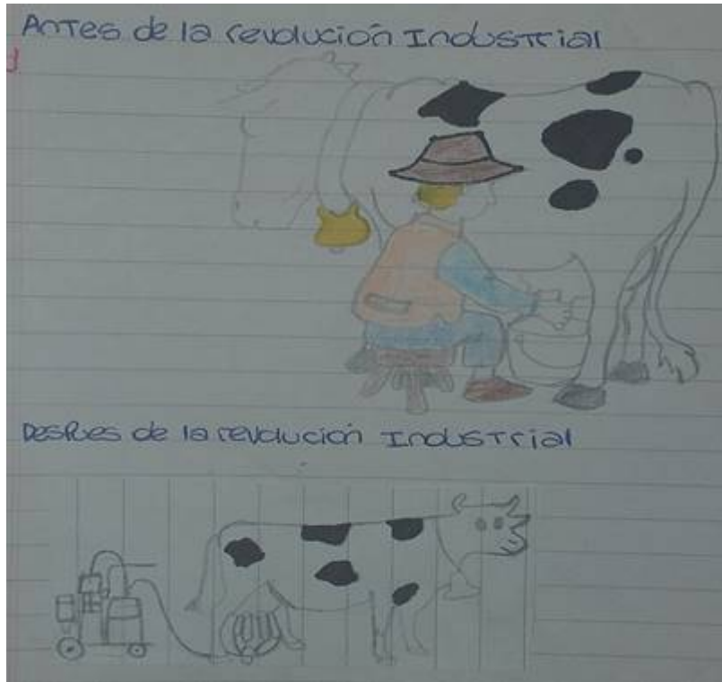
Figura 1. Estudiante 1