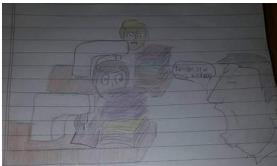
Figura 4. Estudiante 3, segundo dibujo