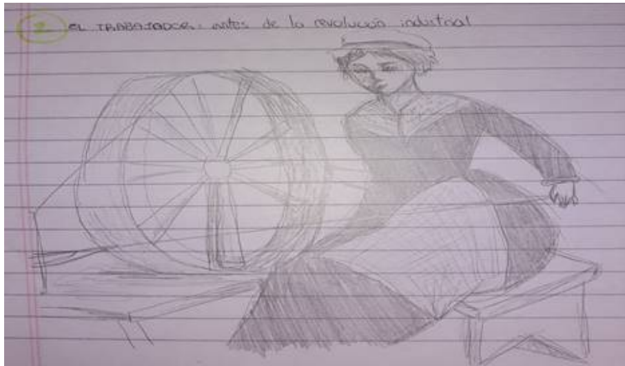
Figura 5. Estudiante 4, primer dibujo