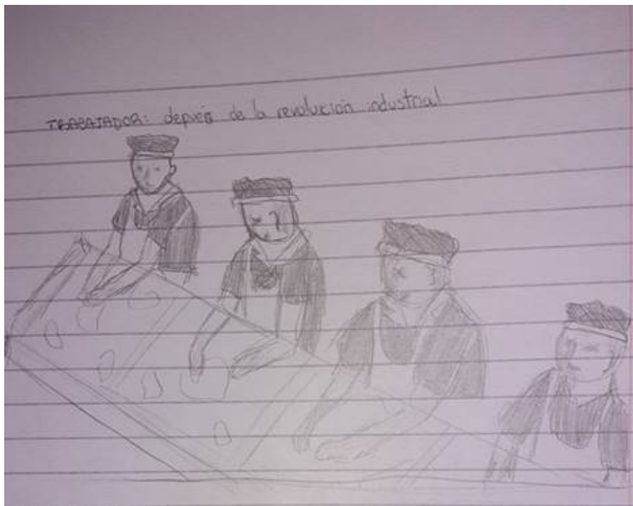
Figura 6. Estudiante 4, segundo dibujo