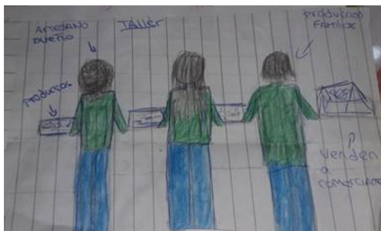
Figura 7. Estudiante 5, primer dibujo