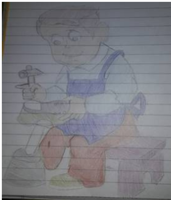
Figura 3. Estudiante 3, primer dibujo