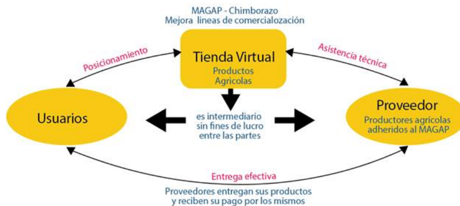
FIGURA 1 Esquema legal del modelo de negocio Esquema obtenido del estudio legal