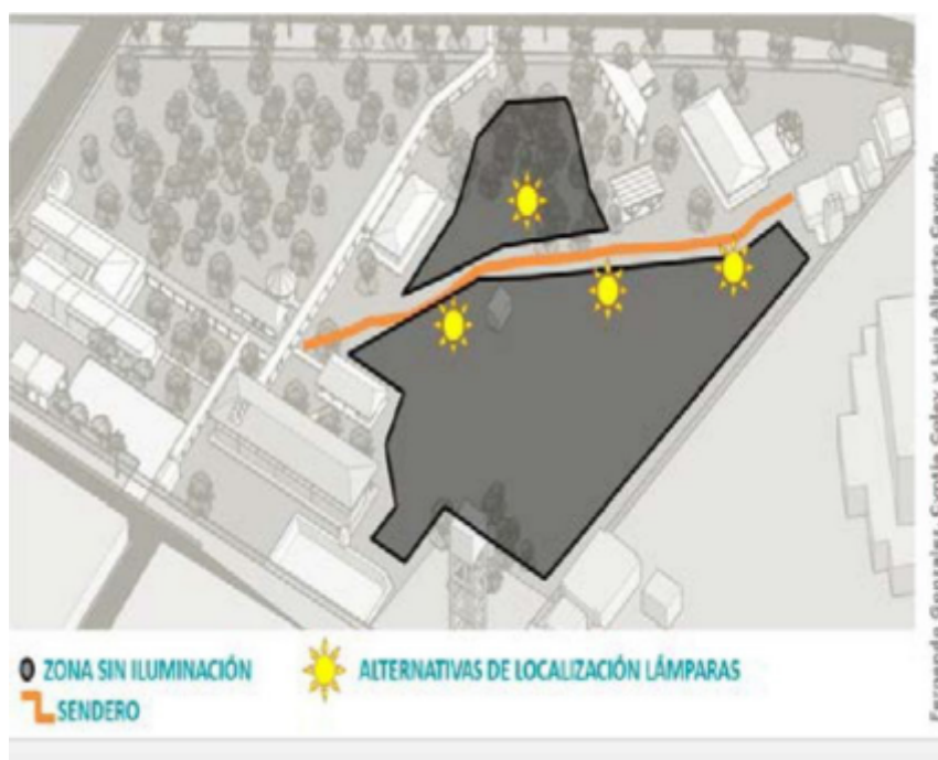
FIGURA 3. Sistema de recolección de aguas lluvias antes de la intervención del proyecto.

De acuerdo con varios estudios analizados en este trabajo, las edificaciones funcionan como almacenamientos de calor durante el día, mientras que la energía almacenada se libera en su espacio interior a lo largo de la noche; así se presenta un efecto negativo, puesto que la demanda de climatización artificial se aumenta y el potencial para la ventilación pasiva se reduce durante la noche. (Muñoz Campillo, y Torres Sena, 2013) Se pretende resolver la carencia de un sector del centro que no cuenta con iluminación ni cableado que permita alimentar lámparas convencionales. Por lo anterior los sistemas foto voltaicos que no requieren conexión a fuente de alimentación, posibilitan verificar y dar a conocer sus beneficios a la comunidad, que dadas las condiciones del Guainía que no está conectado al sistema nacional, es muy pertinente como alternativa de solución viable y rápida que posibilite acceder a los beneficios de la energía a comunidades alejadas.