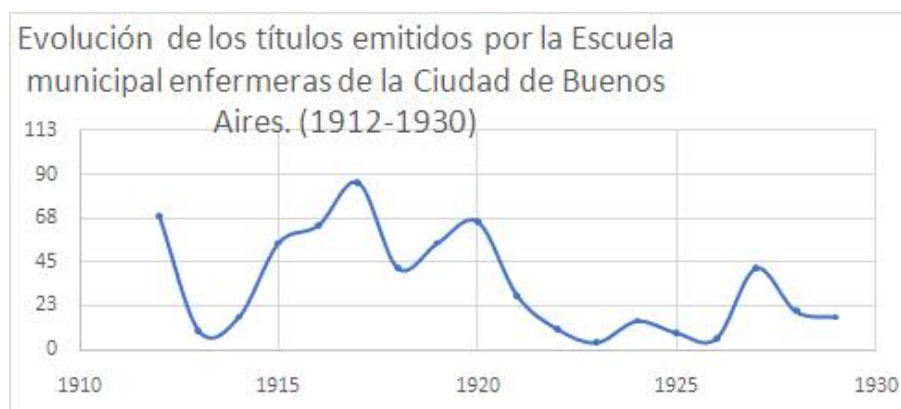
Gráfico n.º 1.