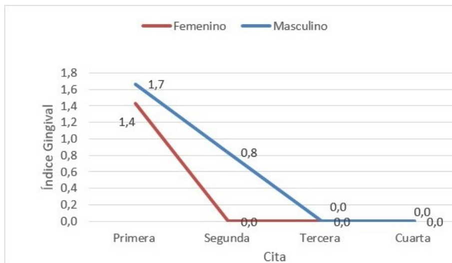
GRÁFICO 1. IG POR GRUPO DE EXPERIMENTACIÓN Y CITA. GRADO DE GINGIVITIS LIGERO: 0,1-1,0. GRADO DE GINGIVITIS MODERADO: 1,1-2,0. GRADO DE GINGIVITIS SEVERO: 2,1-3,0.

SS. En el gráfico 1 se presenta de forma progresiva por citas el IG por grupo de experimentación. De acuerdo al índice de O'Leary, los resultados respecto al grupo correspondiente al género femenino presentaron un índice menor que el masculino desde el inicio hasta el final del estudio (gráfico 2).