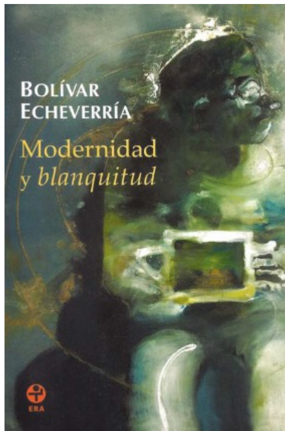
Imagen 3. Modernidad y blanquitud . Bolívar Echeverría (2011). México: ERA

Porque lo que nos dice Benjamin, siguiendo a Marx, es que, cuando la técnica está siendo obstruida por el capital para cumplir sus funciones, que son positivas, las de alcanzar la abundancia para la sociedad, estas mismas fuerzas técnicas revierten su sentido y se hacen destructoras de la sociedad, y plantean como única perspectiva histórica la autodestrucción de la sociedad, o sea, la de la guerra. Porque cuando las fuerzas productivas no están a favor del ser humano se vuelven contra él; cuando no están allí para acrecentar y perfeccionar el mundo de la vida humana, necesariamente se vuelven contra ellos, y se convierten también necesariamente en elementos de destrucción.