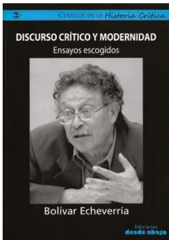
Imagen 1. Carátula del libro: Discurso crítico y modernidad: ensayos escogidos . Bolívar Echeverría (2011). Bogotá: Ediciones desde abajo.

Para comprender esta tesis de Benjamin, debemos recordar la idea general de que el código con el que se comunica el ser humano, en la producción de significaciones prácticas o de significaciones lingüísticas, puede ser usado en la dirección del ciframiento de mensajes y también en el sentido del desciframiento de mensajes. Y según Roman Jakobson, el código con el que nos entendemos en términos lingüísticos o en términos prácticos, al producir y consumir objetos, es uno que funciona de cierta manera cuando está siendo utilizado para cifrar mensajes, y de un modo diferente cuando es necesario descifrar esos mismos mensajes. Descifrar mensajes significa un uso del código en la dirección del desciframiento, que es una utilización mucho más sencilla que el uso del código para efectos del ciframiento del mensaje.