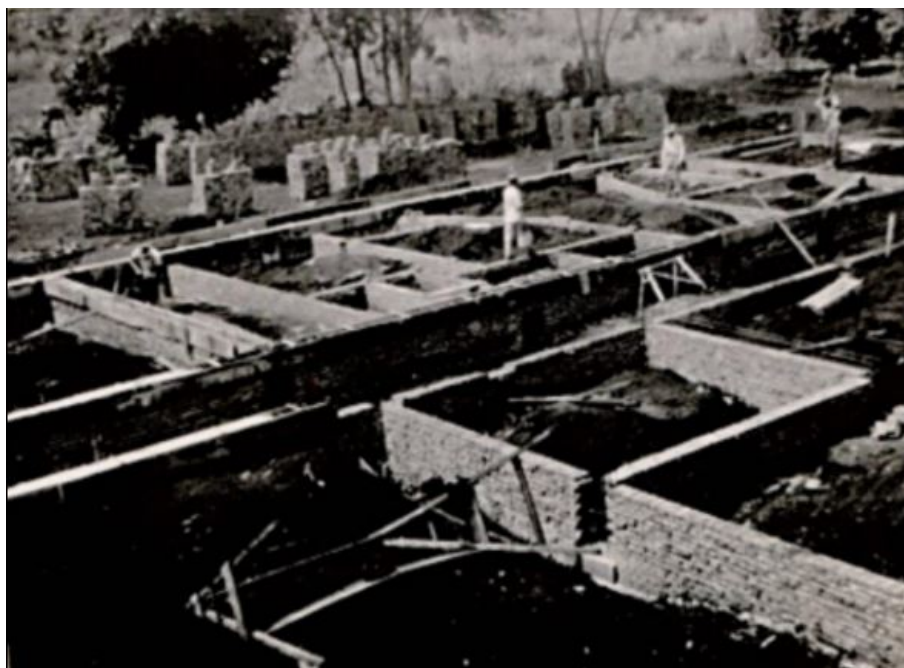
FIGURA 1 Construção da Instituição Franciscana alicerce