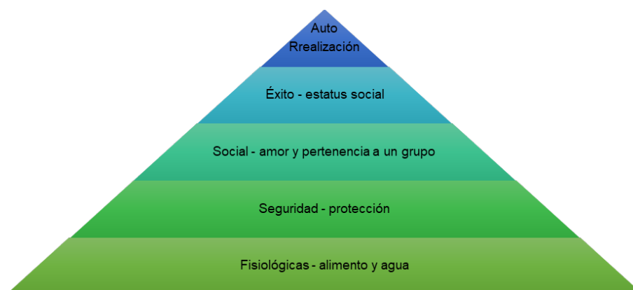
El liderazgo y las necesidades según Maslow.

Por lo consiguiente, a través de este fenómeno psicológico-social la influencia de una persona con poder demandante en una comunidad puede generar un impacto social tanto positivo (acciones de mejora colectiva que permitan el alcance de los objetivos que satisface sus necesidades) o negativo (a través de sus gestiones no consigue un bienestar del grupo liderado). Siendo así que todo líder debe trabajar bajo el enfoque positivo, para ello debe contar significativamente con la aceptación y colaboración voluntaria del grupo a beneficiar para la consecución de resultados favorables, ya que sin un equipo dispuesto a ayudar y ser ayudado, no existe nada que liderar y el sentido del liderazgo pasaría a ser algo bizantino en este contexto.