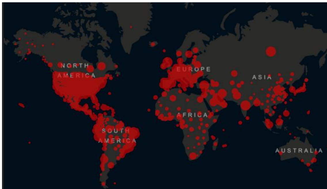
Figura 2. Expansión de COVID-19 a nivel mundial [9]

La salud mental al ser un proceso dinámico de bienestar a consecuencia de la interrelación entre el ambiente y las diversas capacidades humanas, de manera grupal e individual y todos aquellos colectivos que conforma a la sociedad [8], en estos últimos meses se ha visto resquebrajado este bienestar y la salud en general de los seres humanos por haber sido trastocado desde el inicio del brote del COVID-19, al ser esta una enfermedad de aparición repentina en Wuhan, China e inmediatamente al pasar a ser una epidemia en esta área geográfica y en menos de un mes se propagó a otros países, haciendo que la OMS la declare como una pandemia y como consecuencia esta se convierte en una vulnerabilidad psicosocial, debido a que la población a nivel mundial está expuesta a esta amenaza del virus, por la gran cantidad de enfermos y muertos y pérdidas económicas que se ha dado por la pandemia [5, 10], y lo cual ha sumido al mundo en la incertidumbre, el miedo, la angustia, la desesperanza [6], por lo que se estima un incremento de la incidencia de trastornos psíquicos, entre una tercera parte y la mitad de la población expuesta podrá sufrir alguna manifestación psicopatológica, de acuerdo a la magnitud del evento y el grado de vulnerabilidad [5] y con mayor énfasis en los estados de ánimo.