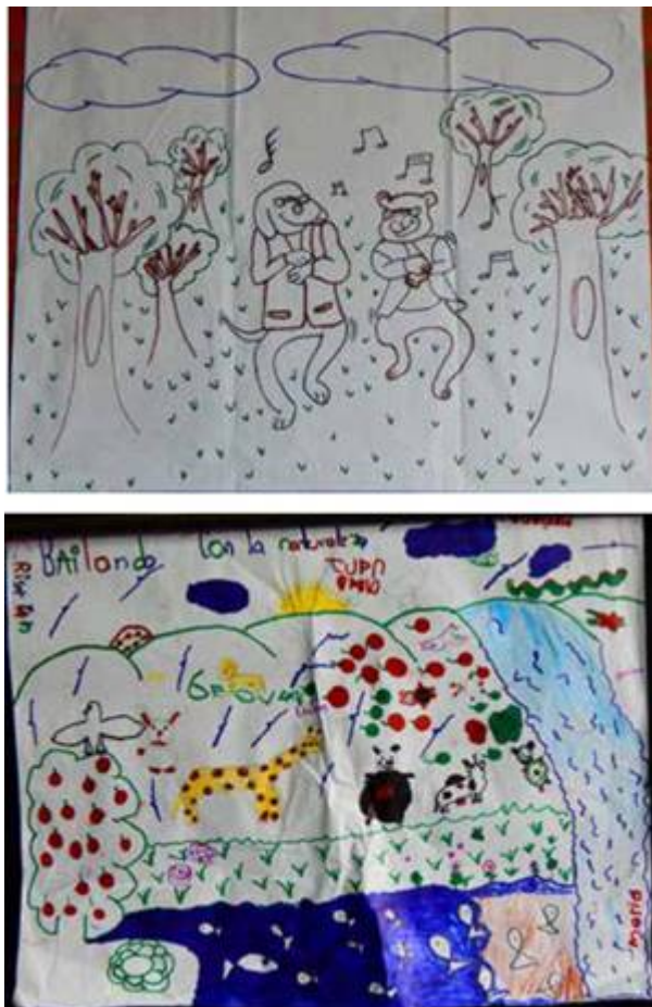
Figura 2 y 3.