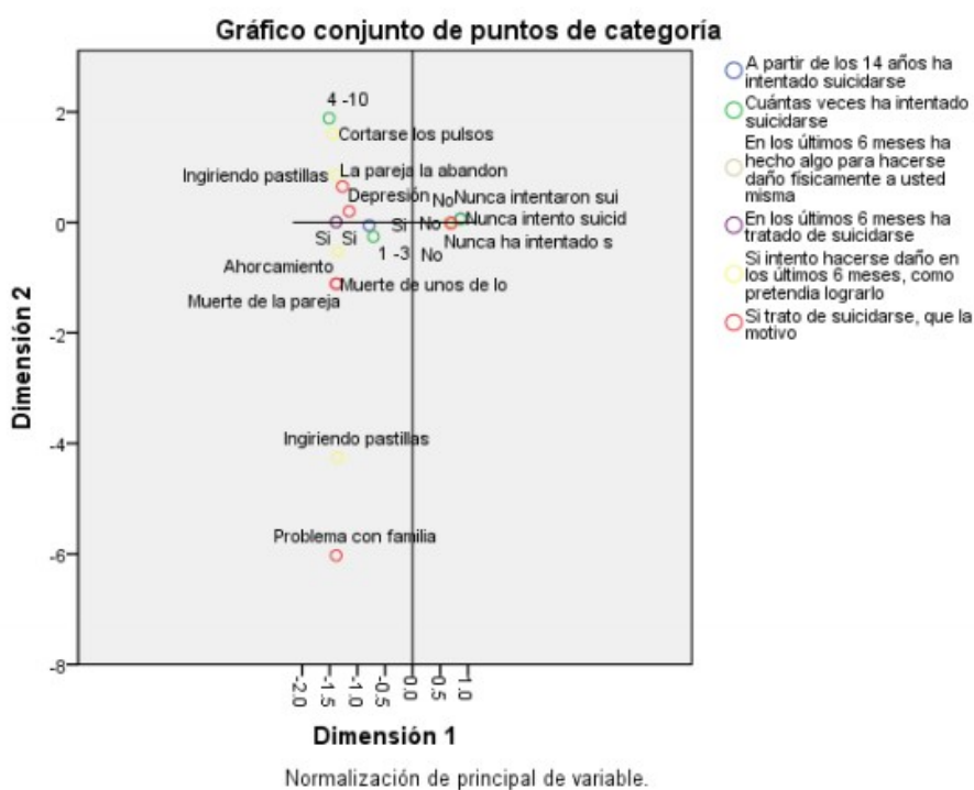
GRÁFICO 1 Análisis correspondencia múltiple