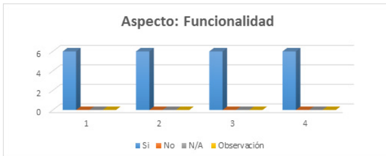
Ilustración N° 6

Gráfica sobre aspectos de funcionalidades de la aplicación.