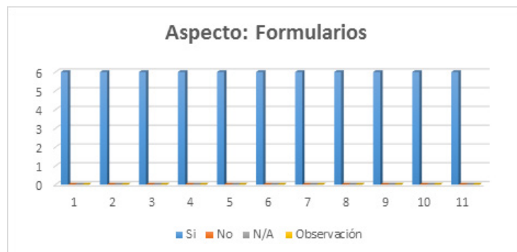
Ilustración N° 4

Las etiquetas están cerca de los campos del formulario (ej. Las etiquetas están justificadas a la derecha).