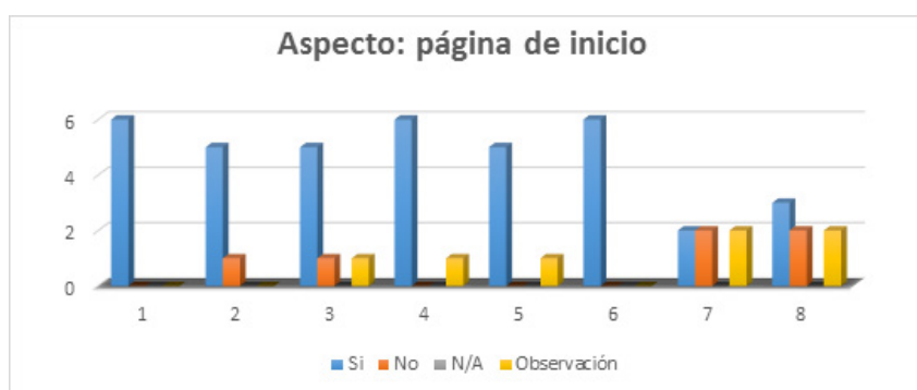
Ilustración Nº 2

Gráfica sobre valoración de aspecto de la página de inicio de la app.