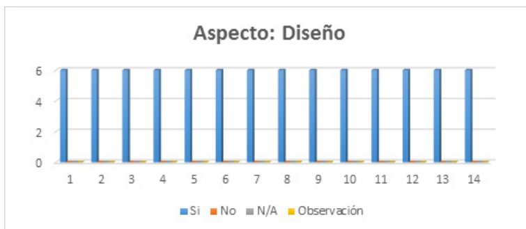
Ilustración N° 5

Las características que atraen la atención (como animaciones, las negritas y los elementos de diferente tamaño) están siendo utilizadas con moderación y solo cuando son relevantes.