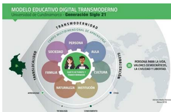
FIGURA 1. MEDIT.

El campo multidimensional de aprendizaje, como se observa en la figura 2, lo integran 3 campos (institucional, disciplinar y cultural) y 7 dimensiones (persona, aula, cultura, familia, naturaleza, institución y sociedad), que operan conjuntamente con el fin de lograr la formación de una persona para la vida, los valores democráticos, la civildad y la libertad.