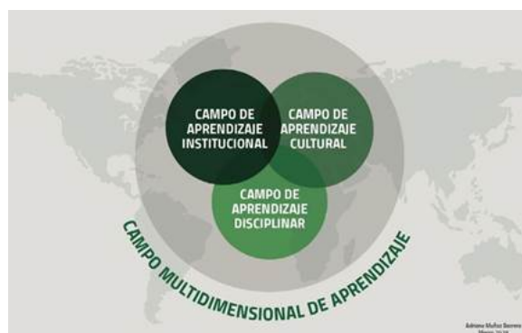
FIGURA 2. Campo multidimensional de aprendizaje.