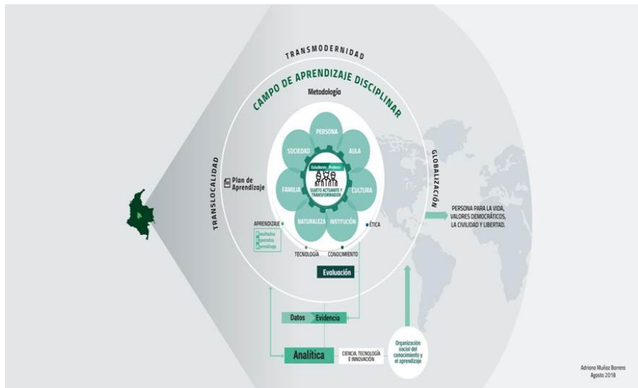
FIGURA 5. Campo de aprendizaje institucional

El campo de aprendizaje disciplinar (figura 5) corresponde al saber de cada disciplina que la Universidad ofrece al departamento de Cundinamarca, la nación y el mundo.