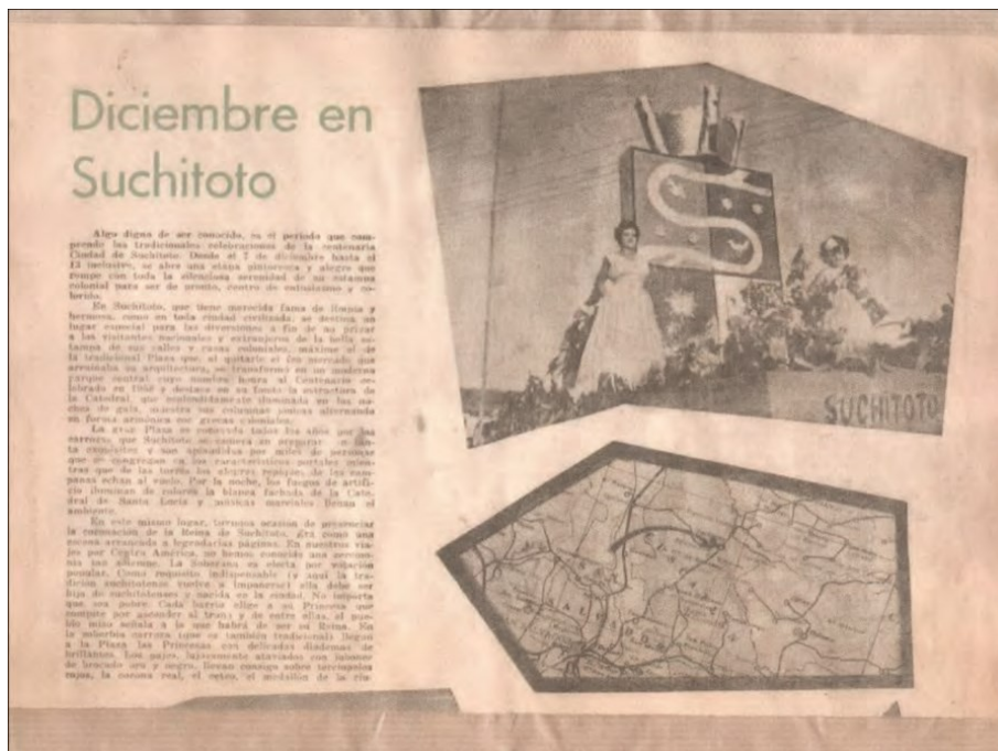
FIGURA. 3 Presenta un fragmento del filme “Universo Menor”

En la década de 1980, el cine crecía a grandes pasos, en especial en Estado Unidos era un referente del cine comercial en Latinoamérica. A nivel local, el desarrollo se dio a un ritmo muy lento. Un punto detonante en el cine local se vería perjudicado en gran manera por los movimientos sociales y conflictos internos que iban moldeando una larga y sangrienta guerra civil en El Salvador (Marroquín Díaz, Durán Rodríguez y Olmedo Grande, 2012, p. 5). Ejemplo de ello, es el filme “Universo Menor” (ver figura 2 y 3). Filme que inicio en 1979, pero, debido al conflicto armado, Cotto dejo de producirla. El filme, tenía como objetivo dar a conocer las fiestas populares del municipio de Suchitoto. Y la denuncia de la construcción de la represa el Cerrón Grande. Denuncia que fue estéril. Ya que muchas personas fueron despojadas de sus tierras sin su consentimiento (Manuscrito de Cotto, 1979).