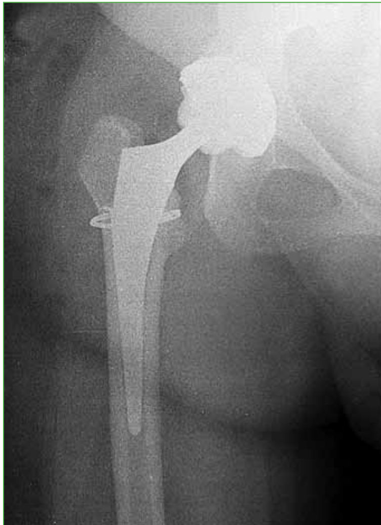
Figura 2. Tallo de primera generación con fractura de calcar intraoperatoria, que se resolvió con una lazada de alambre.

Al evaluar al grupo 1, contemplando el primer año de seguimiento posoperatorio, se produjeron dos (2,44%) complicaciones durante la cirugía. La primera fue una fractura de calcar, que se resolvió colocando una lazada de alambre en el mismo momento, evaluando la estabilidad inicial con la raspa de prueba y luego colocando el tallo definitivo (Figura 2). La segunda complicación fue una falsa vía generada mientras se trabajaba el canal femoral (Figura 3A), la cual se resolvió a las 24 h, en un segundo tiempo quirúrgico, con el correcto reposicionamiento del mismo componente primario (Figura 3B).