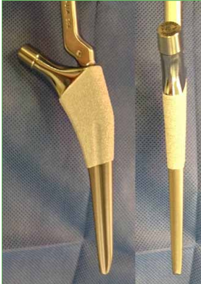
Figura 1. Tallo de segunda generación (Accolade II, Stryker Orthopaedics, Mahwah, NJ, EE.UU.).

El grupo 1, que recibió un tallo no cementado de fijación metafisaria de primera generación, Accolade TMZF (Stryker Orthopaedics, Mahwah, NJ, EE.UU.), incluyó 82 ATC en 75 pacientes (7 bilaterales): 41 hombres y 34 mujeres, con un promedio de edad de 53.5 años (rango 27-80). Cuarenta y seis de las 82 ATC fueron en caderas derechas (56,1%) y 36 (43,9%), izquierdas. Las causas de las ATC en este grupo fueron: coxartrosis (75 pacientes, 91,5%), luxación congénita de cadera (2 pacientes, 2,44%), conversiones de espaciador a ATC por artritis séptica (2 pacientes, 2,44%), secuela de artritis séptica (1 caso, 1,22%) y necrosis avascular de la cabeza femoral (1 caso, 1,22%).