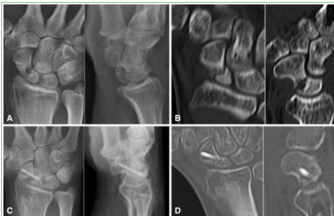
Figura 2. A y B. Radiografías e imágenes por tomografía computarizada que revelan una pseudoartrosis de polo proximal, de cuatro meses de evolución. C y D. Radiografías al año de la cirugía e imágenes por tomografía computarizada a los cuatro meses de la cirugía. Se observa la consolidación.