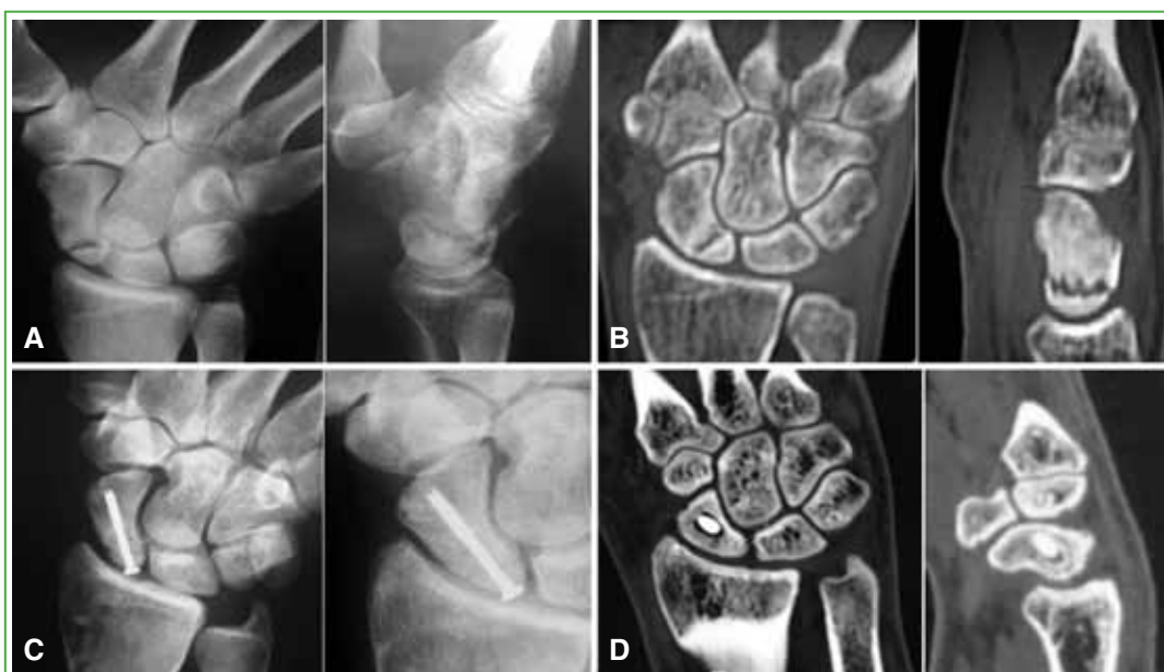
Figura 3. Hombre con antecedente de trauma de 10 meses de evolución. A y B. Radiografías e imágenes por tomografía computarizada preoperatorias que muestran una pseudoartrosis de polo proximal. C y D. Radiografías e imágenes por tomografía computarizada a los seis meses de la cirugía. Se observa la consolidación.