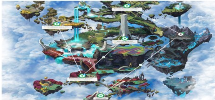
FIGURA 2. Ubicación de contenidos. https://game.classcraft.com/

Es aquí, donde cada estudiante percibe gran contenido de valor con respecto a su aprendizaje en las operaciones elementales, conforme su dedicación, su esfuerzo y perseverancia, la plataforma asigna bonos, monedas, o experiencia. Además, cuando sus participantes envían las tareas antes de la fecha asignada, los círculos verdes comprenden las misiones, al ingresar en la primera de ellas, se despliega un saludo de bienvenida, y explica de manera breve su funcionalidad. A su vez, las misiones se desbloquean de manera automática cada vez que el estudiante complete un reto, podrá visibilizar en su mapa el próximo desafío