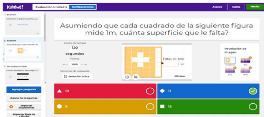
Figura 4. Evaluación.