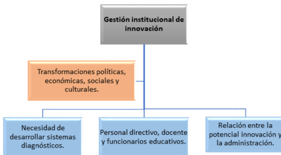
FIGURA 1 Gestión institucional de innovación

Así la misión del maestro es expandir su consciencia y empoderarse con metodologías activas y prácticas digitales, ejecutables en las aulas de aprendizajes con sus educandos. Además, de propiciar las relaciones interpersonales y los cambios actitudinales, climatizando un ambiente organizativo funcional (Delahoz-Dominguez, Fontalvo & Fontalvo, 2020). A razón de lo planteado, a continuación se esboza las nuevas formas de gestionar la institución educativa.