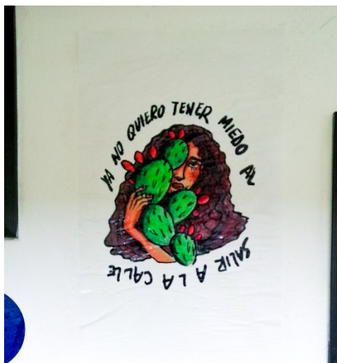
Fig. 4. Propuesta de paste up acerca de la inseguridad social. Mujer Semilla. Año 2019.