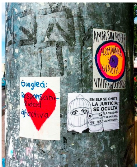
Fig. 2. Ejemplos de paste up de Gráfica X Morritas en San Luis Potosí. Año 2019.