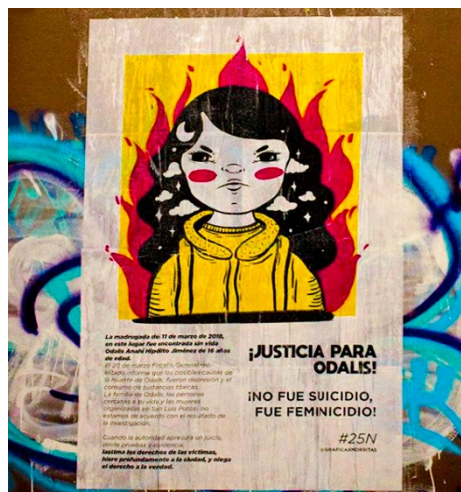
Fig. 3 Paste up sobre el asesinato de Odalis. Zona Centro de San Luis Potosí. 25 de noviembre de 2020.

Las colectivas emplean a las mujeres como tema gráfico por dos motivos, el primero, se asocia a la ideología feminista en el arte, donde el “objeto artístico, como cualquier mercancía, debe tomar apariencia de fetiche, provocar conmoción social, generar sentimientos de choque e, incluso, transmitir una sensación autodestructiva” (Escudero, 2003, p. 305). Buscan el impacto visual mediante la representación de las mujeres en situaciones reales dentro del ámbito cotidiano para mostrar los efectos que tiene el sistema sexo-género sobre los cuerpos femeninos. Los cuerpos son transfigurados en mensajes y estadísticas que exponen información referente a las violencias que las afectan. Además, exhiben sentimientos y emociones respecto a sus experiencias al interior de Aguascalientes o San Luis Potosí (ver figura 3).