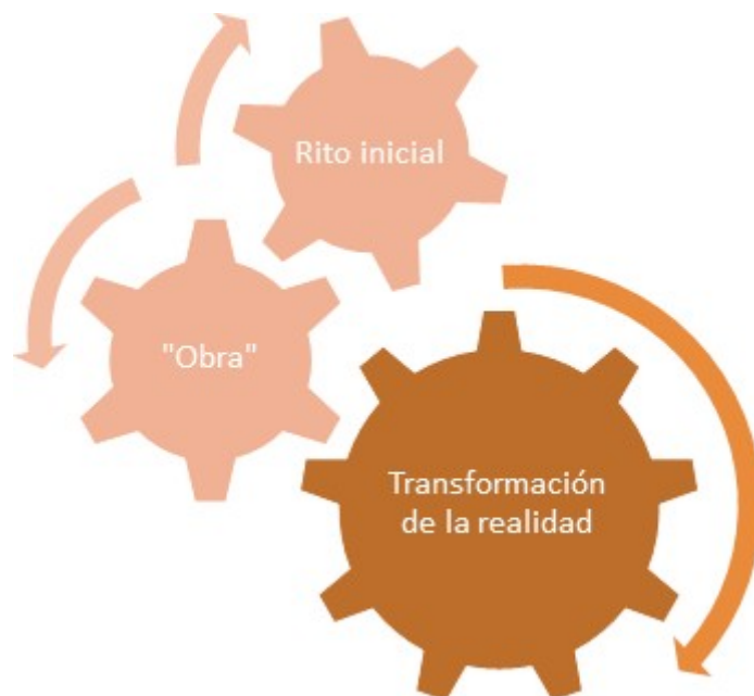
FIG. 1. Ritualidad en torno a la provocación.

- Tercero, a través de un gesto o una palabra, se invita a los niños a entrar al espacio escenográfico e intervenir sobre los materiales dispuestos, permitiendo la transformación de la realidad a partir de la “obra” por parte de los niños.