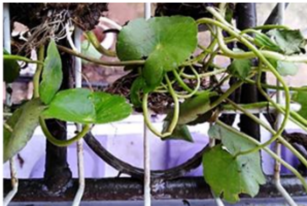
FIG. 1 Hydrocotyle umbellata , (Apiaceae)

La descripción taxonómica de Hydrocotyle umbellata es una hierba perenne, anual o bianual, frecuentemente rastrera. Tienen hojas largamente pecioladas, de color verde pálido, hirsuto, alternas, basales o a veces opuestas simples y enteras, con un peciolo envainador de 2-5 cm de largo y 0,5-1 mm de diámetro, tiene nudos radicantes con tallos filiformes de 0,5-1mm de diámetro. (Álvarez, 2001). La base de la lámina emarginada en ángulo agudo, las espículas irregularmente romboidales o auriculares, tenues, membranosas (Álvarez et al., 2008, Stevens et al., 2001) (Fig. 1).