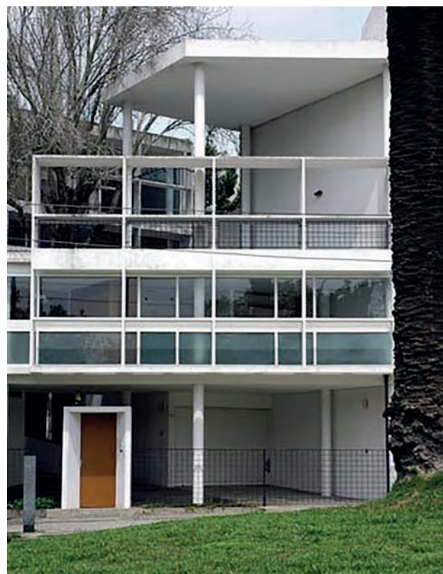
[ Figura 2. Vista perspéctica mediante proyecciones cónicas , fotografía, de la fachada de la casa Curutchet. Esta imagen responde a una promesa de cierta habitabilidad, aceptada contextualmente. ]