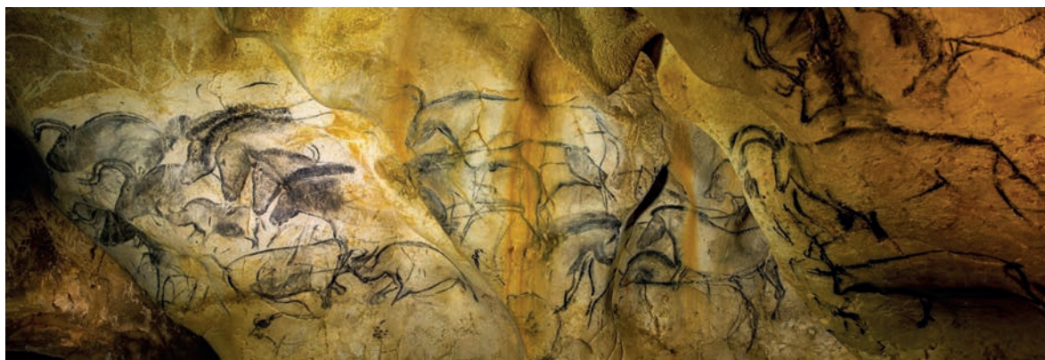
[ Figura 1. Imagen panorámica que a la luz de las antorchas –probablemente– lograba representar el movimiento. ]