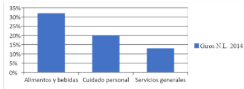
GRÁFICA 2 Principales Giros de las franquicias en Nuevo León

Cabe señalar que dentro de las principales 10 franquicias exitosas en Nuevo León (Cuadro No.3) se encuentran franquicias desarrolladas bajo el talento regiomontano y que han demostrado estar a la altura de las mejores en el mundo, ya que algunas de ellas ya están ubicados en otras partes del mundo, logrando así exportar su talento e innovación hacia otros lugares.