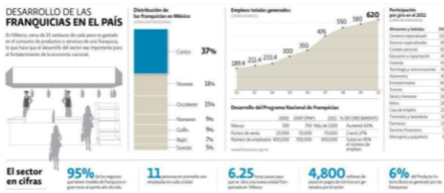
FIGURA NO. 2 Desarrollo de las Franquicias en México al 2011

Se encontraron unos estadísticos del 2011 que prueban que el desarrollo de las Franquicias en México ha sido favorable para la economía mexicana ya que se puede observar en la figura No. 2 que se aumentaron más de 430,000 empleos del 2002 al 2010, así como los puntos de venta que pasaron de 25 mil a 45 mil. La importancia de esta modalidad se manifiesta al mostrar que el 95% de estos negocios seguían vivos al 5to. año, y que se abría una nueva franquicia cada 6.25 hrs., pero sobre todo que generaban el 6% del PIB en México.