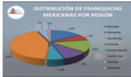
CUADRO NO.2 Distribución de Franquicias Mexicanas por Región al 2013 Fuente: Asociación Mexicana de Franquicias, 2014

Se encontraron unos estadísticos del 2011 que prueban que el desarrollo de las Franquicias en México ha sido favorable para la economía mexicana ya que se puede observar en la figura No. 2 que se aumentaron más de 430,000 empleos del 2002 al 2010, así como los puntos de venta que pasaron de 25 mil a 45 mil. La importancia de esta modalidad se manifiesta al mostrar que el 95% de estos negocios seguían vivos al 5to. año, y que se abría una nueva franquicia cada 6.25 hrs., pero sobre todo que generaban el 6% del PIB en México.