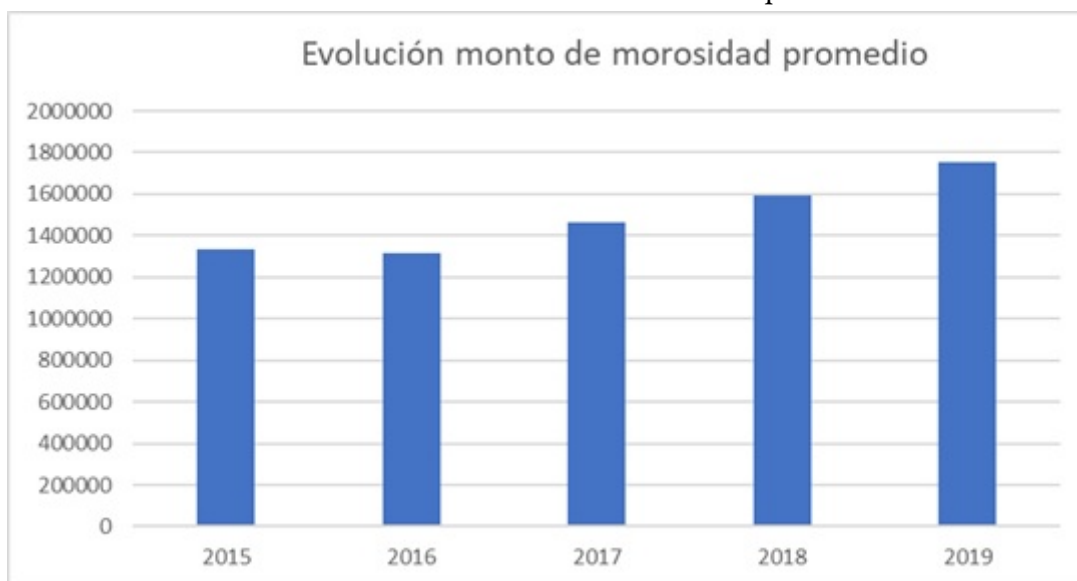
Gráfico 3. Evolución del monto de morosidad promedio.

Elaboración propia en base a XXIV encuesta de deuda morosa USS-Equifax (2019)