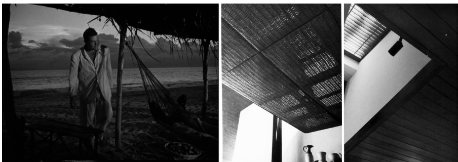
Figura 7, 8 y 9

“Cuando hizo la casa de Zbar, en el último piso en la calle 49, tenía un cielorraso muy bajito que medía 2.10 que era un techo con mimbre. Lo había mandado a hacer con un canastero el cielorraso él, y tenía un papel o un plástico traslúcido y los tubos fluorescentes arriba y eso daba una luminosidad muy suave y muy pareja. Y él decía que para hacer ese techo se había inspirado en un atardecer que se muestra en la Dama de Shanghai, que se ve desde una playa. Yo vi la película después y se ve un cielo encapotado, así, que terminaba de golpe y después se veía el cielo allá y entonces la luz que daban las nubes esas, y quería repetir esa situación en la casa, que le parecía buenísima.” [20]