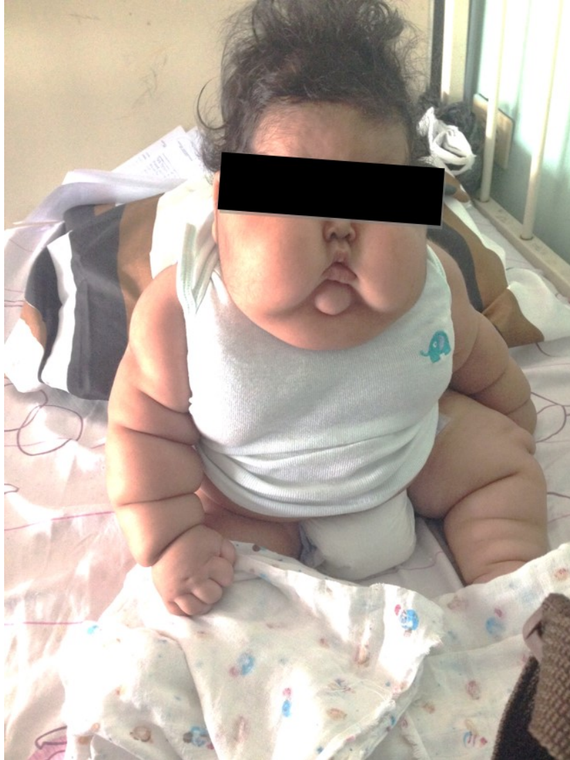
FIGURA 2 Paciente a los diez días de ingreso.

A los diez días de ingreso se evidencia normalización de valores de colesterol y de transaminasas. (Figura 2) Egresó a los 19 días de hospitalización con mejoría de hallazgos clínicos. (Figura 3, Figura 4).