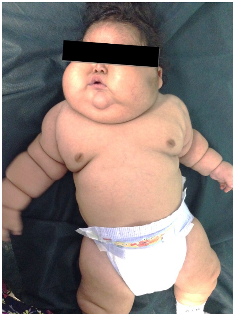
FIGURA 1 Paciente al ingreso.

En vista de hallazgos al examen físico y antecedente de aplicación de esteroides tópicos por largo plazo, se plantea un síndrome de Cushing iatrogénico por exposición a Propionato de Clobetasol.